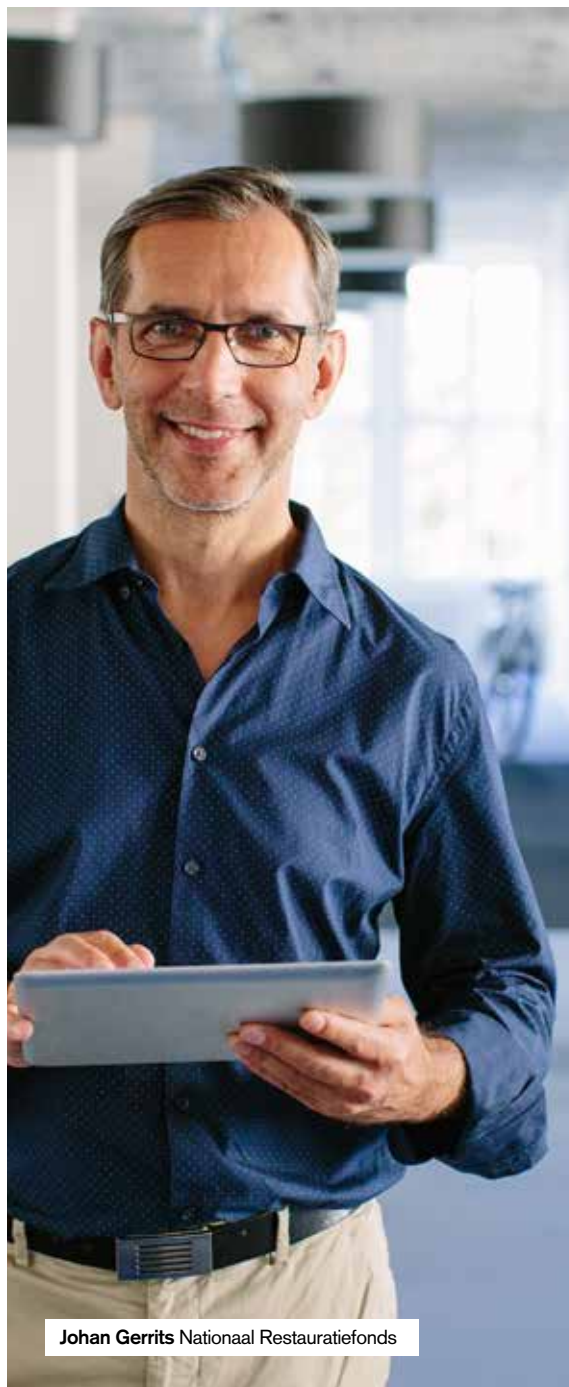
Johan Gerrits Nationaal Restauratiefonds

Phasellus viverra nulla ut metus varius laoreet. Quisque rutrum. Aenean imperdiet. Etiam ultricies nisi vel augue. Curabitur ullamcorper ultricies nisi. Nam eget dui. Cras dapibus. Vivamus elementum semper nisi.